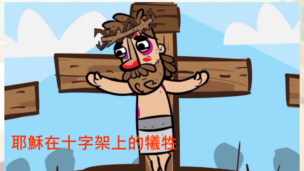
耶穌在十字架上的犧牲